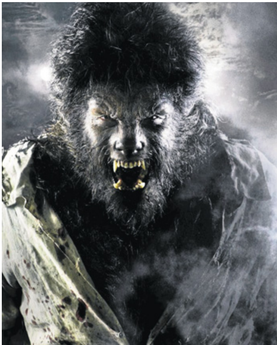
FÖRBANNAD. Benicio Del Toro har allvarliga problem med hårväxt i kommande filmen "The Wolfman".