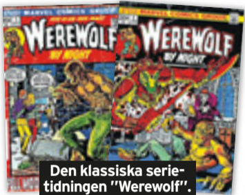
Den klassiska serietidningen "Werewolf".

tillfällen att han minns inte skulle ha några problem med att tillfredsställa den stackars sexuellt frustrerade Bella.