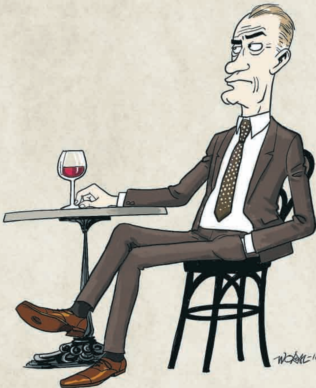
ILLUSTRATION: ANDERS WORM